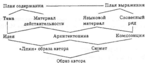
Рис. 2. Структура содержания