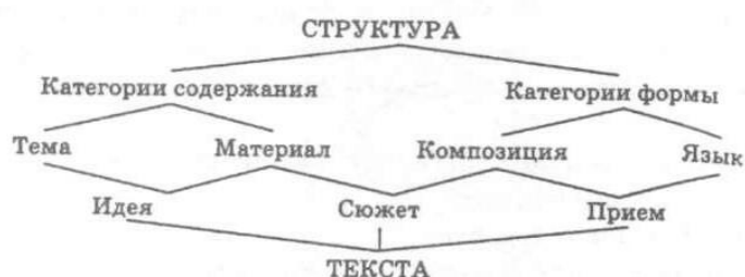
Рис. 1. Структура текста

Синтагматика. Парадигматика. Категория содержания.